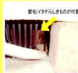
獣毛(イタチ)らしきものが付着

配線を通すために床下換気口の金属柵の一部を切り取っており、そのために生じた隙間に十分な処置を施さず放置しておいたため、イタチが侵入したと推測されます。お客様より『工事がずさん・・・』との厳しいお叱りをいただきましたが、まったくご指摘の通りで返す言葉もありませんでした。お詫びを申し上げると同時に善後策をご相談し、まず、イタチを追い出してから換気口を網でふさぐ処置をする、しかる後、シミがついて汚れてしまった天井板を交換する、ということでご理解